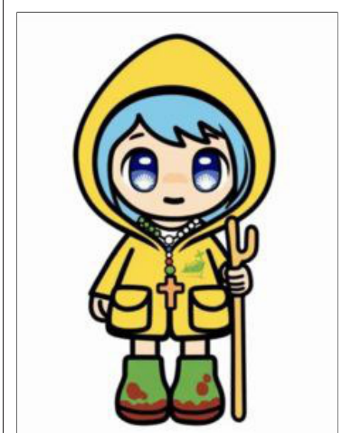
Luce, pelgrim van hoop